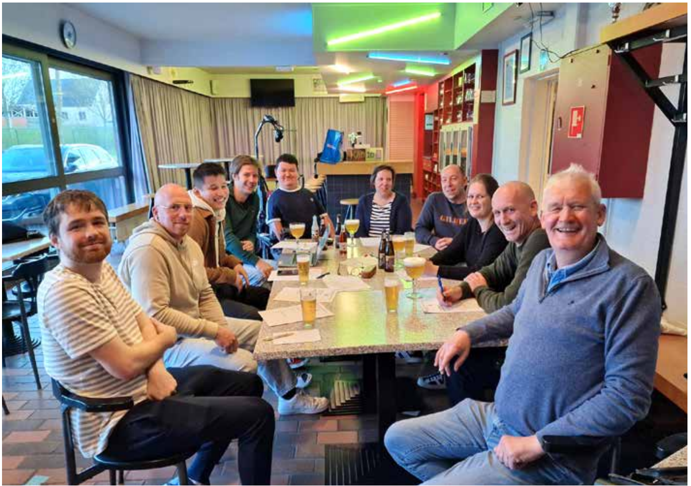
Coaches in vergadering