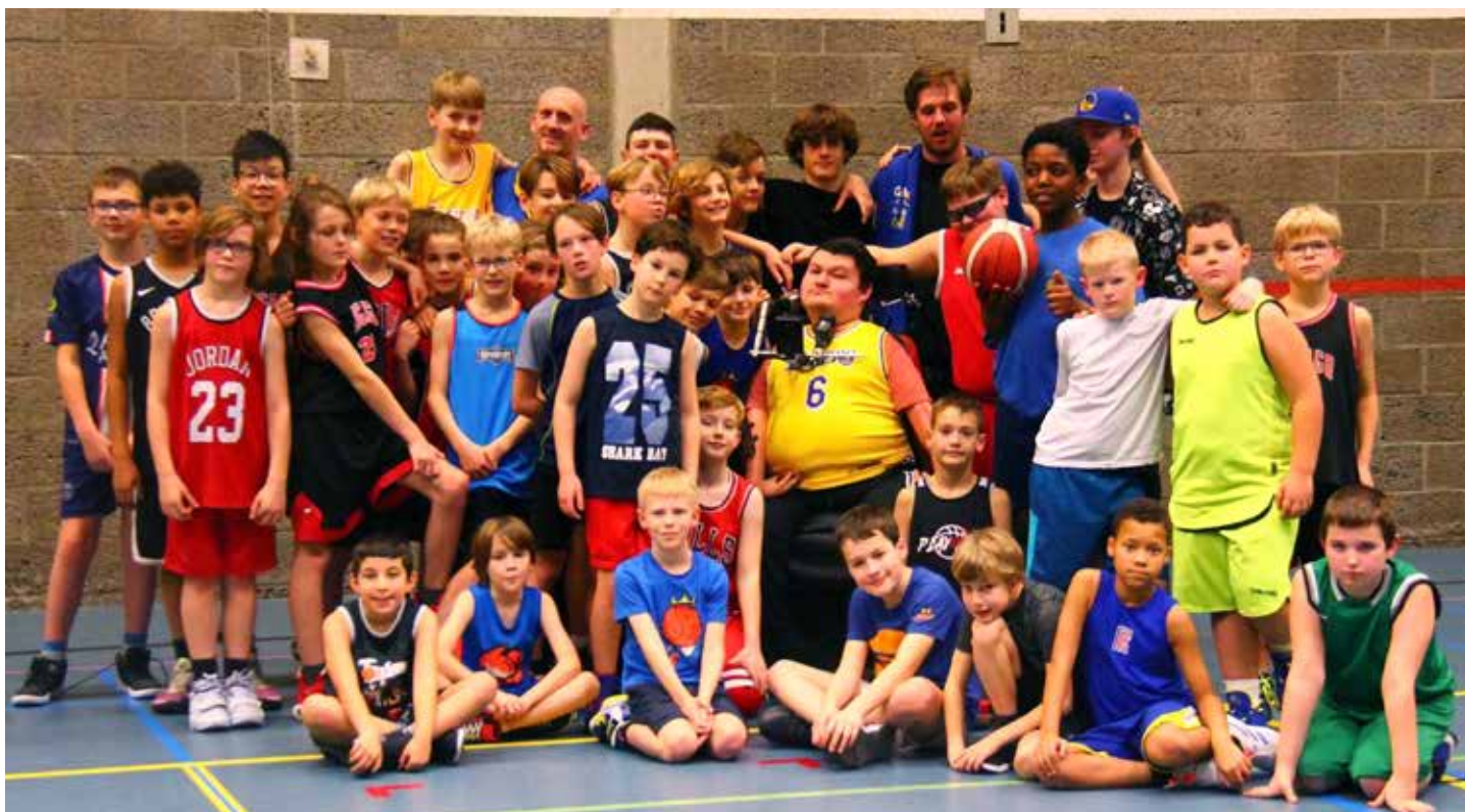
Deelnemers U10-U12-U14 op onze jaarlijkse kerststage

spelers worden gevraagd om eens een handje toe te steken. Twee vliegen in een klap: een gezellig club-lokaal en extra inkomsten voor onze club. Voorts kunnen gezinnen met een zeer beperkt gezins-inkomen een vertrouwelijke aanvraag doen voor een bijkomende sociale korting. En niet te vergeten de meeste mutualiteiten geven een bijkomende premie voor deze sportactiviteit in clubverband. Neem gerust contact op met ons secretariaat voor meer vragen of een kosten berekening op maat.