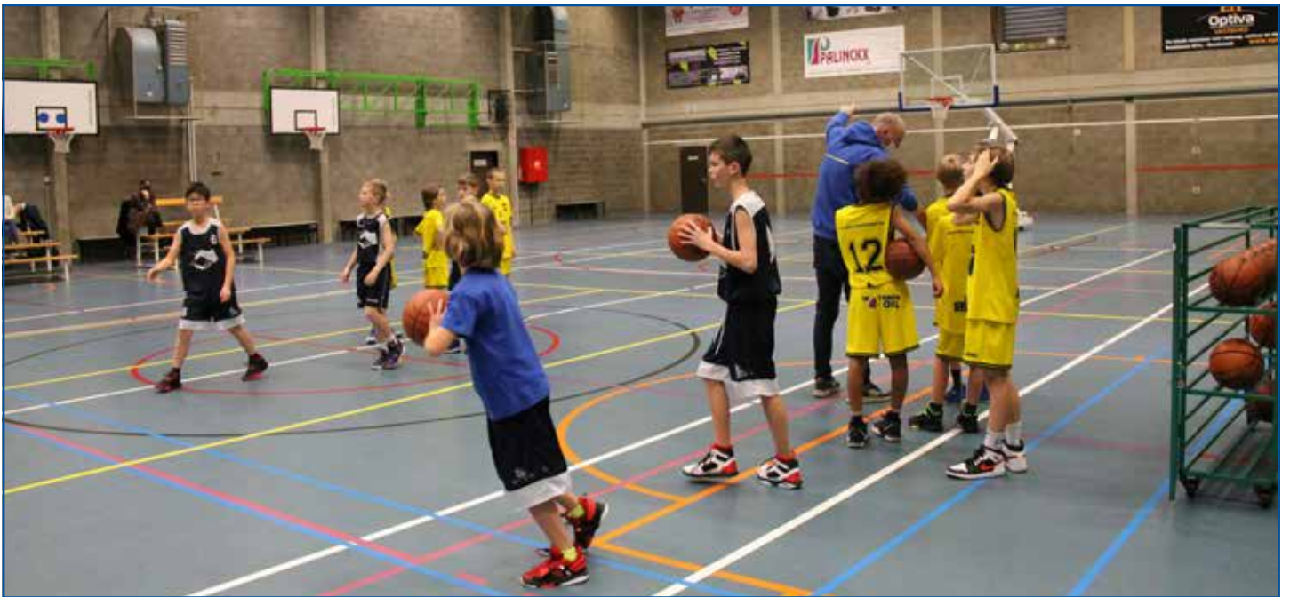
Opwarming voor de wedstrijd