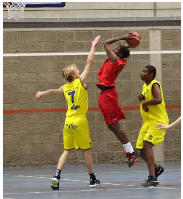
Stop de aanvaller