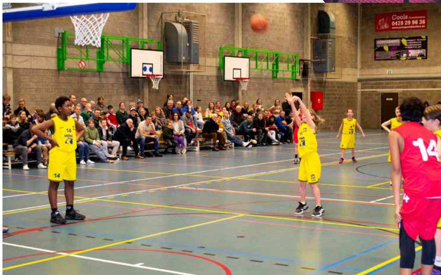
De perfecte vrijworp