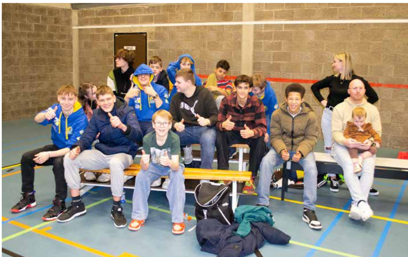
Jeugd basket supportert voor jeugd basket

Geeft vooral advies op sportief en sociaal vlak, deze groep bestaat uit afgevaardigde van de ploegverantwoordelijken, bestuursleden, club en de secretaris van de club. De sportraad komt regelmatig samen en bespreekt kleine en grote beslommeringen.