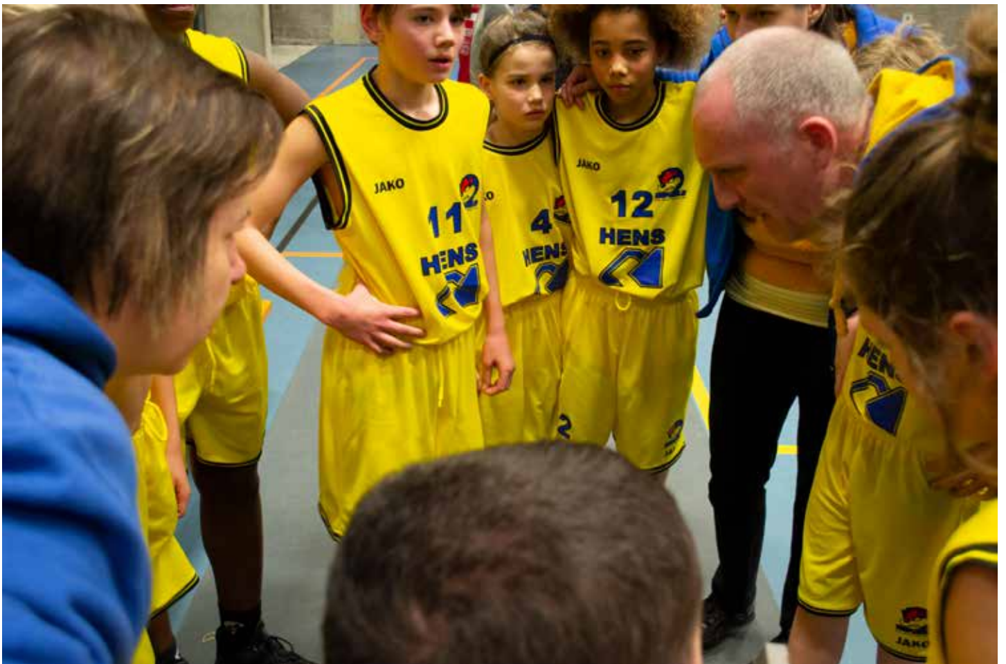
Concentratie tijdens een time out