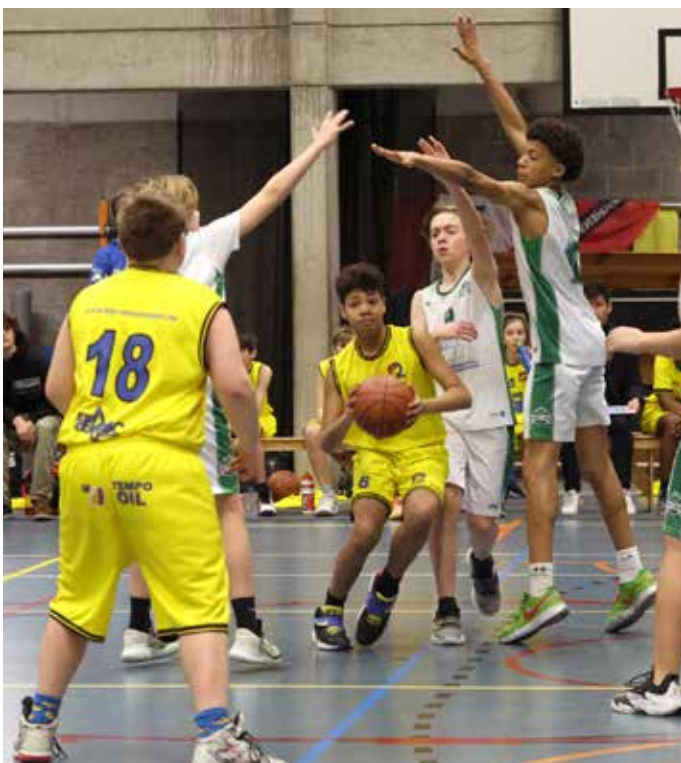
Een moeilijke doorgang