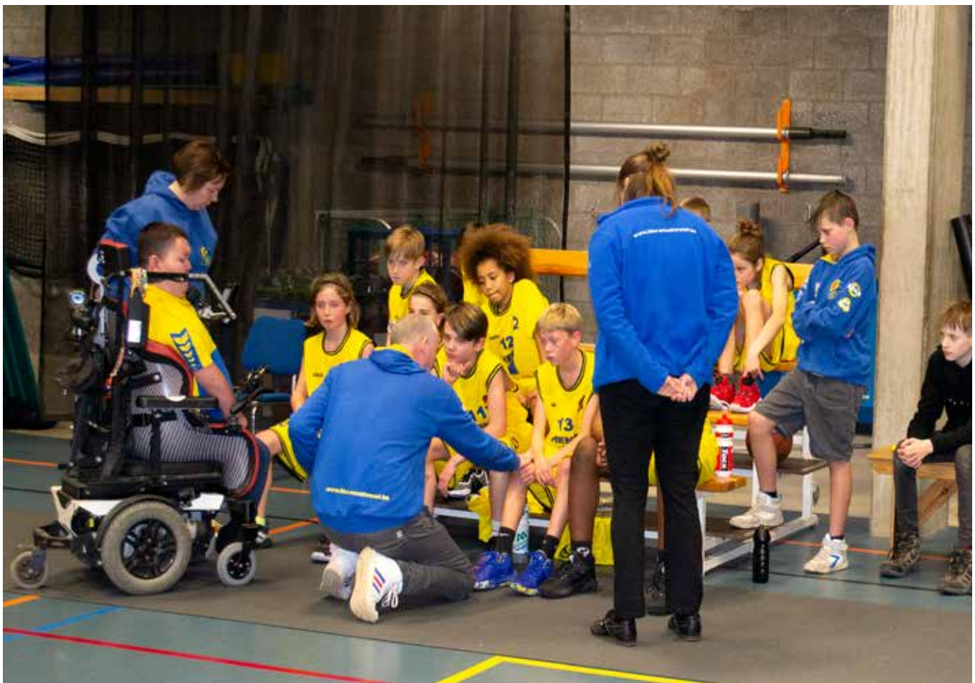
Concentratie tijdens een time-out