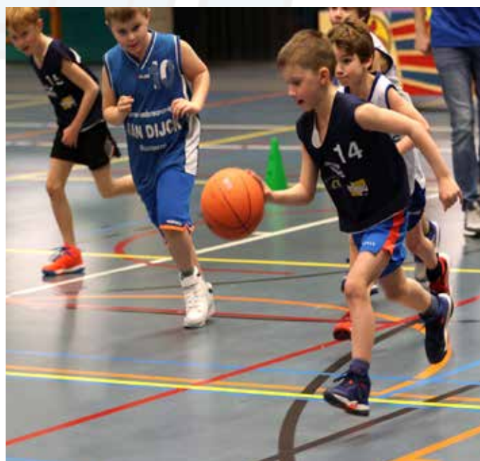
Youngsters in volle actie