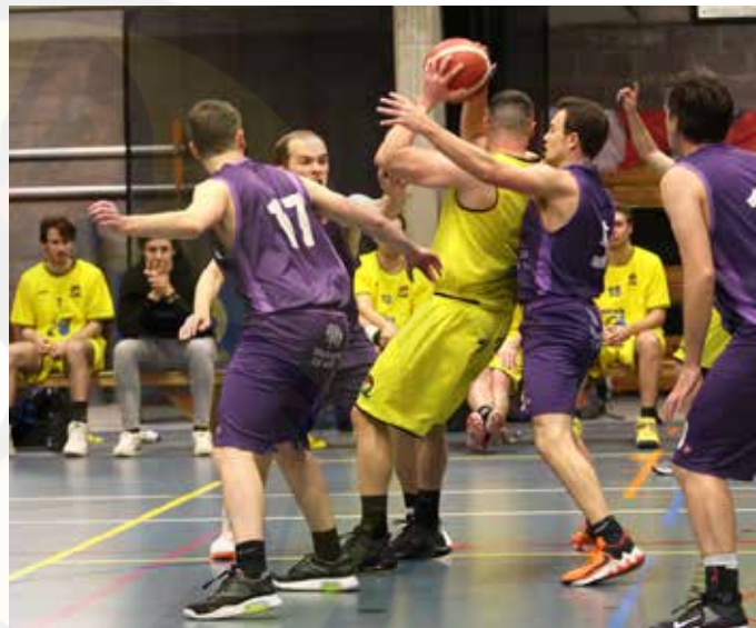
In stijl achterover

Om te spelen heb je uitrusting nodig; shirt, broek, kousen en basketbalschoenen. Voor de wedstrijden moet je als speler of speelster enkel je basket-schoenen en sportsokken meebrengen en kan je spelen in de club tenues. Voor de trainingen heb je ook nog wel een eigen sport tenue nodig. BBC Wuustwezel betaalt voor iedere speler de aansluiting bij de Vlaamse Basketliga (VBL). Daarmee is iedere speler verzekerd tegen mogelijke sportongevallen. Daarnaast moeten we aan de gemeente Wuustwezel huur betalen voor het gebruik van de sporthal en de materialen en dienen de scheidsrechters en trainers een vergoeding te krijgen. Tenslotte moet onze club heel wat materiaal voorzien. Om al deze zaken te betalen en om ons lidgeld zo laag mogelijk te houden, dient de club ook voldoende inkomsten hebben. Activiteiten en ons club-magazine staan centraal om dit te bekostigen. Sinds enkele seizoenen verzorgt onze club mede de bediening van de Kan10. Aan alle ouders en volwassen