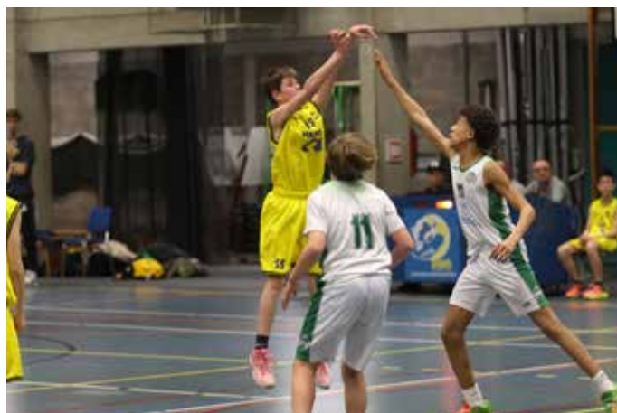
Follow trough na het shot

09u00 - 12u30 - 13u30 - 18u00 zaterdag 09u30 - 12u30 - 13u30 - 17u00 donderdag en zondag gesloten