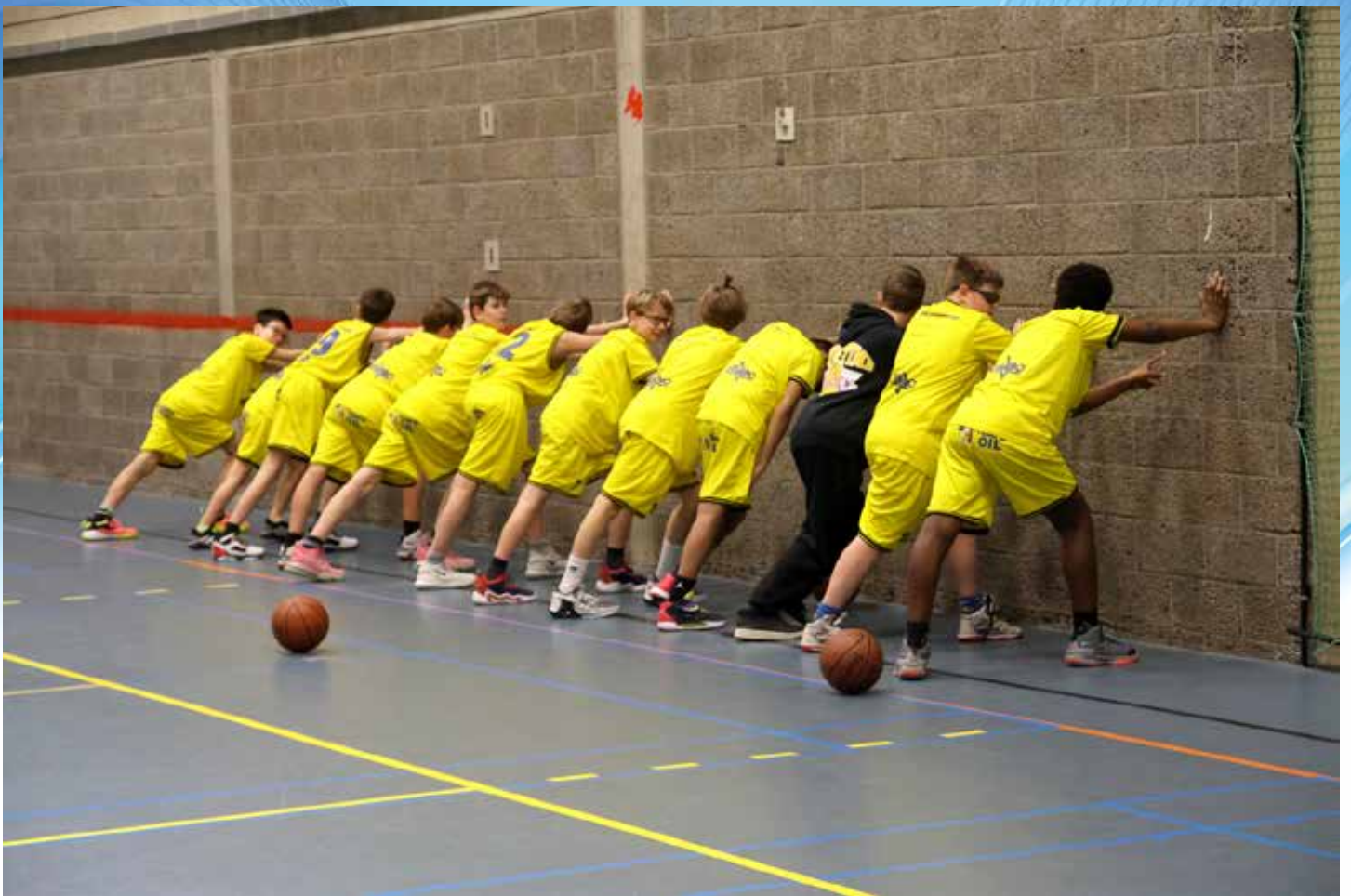
Samen stretchen voor de match